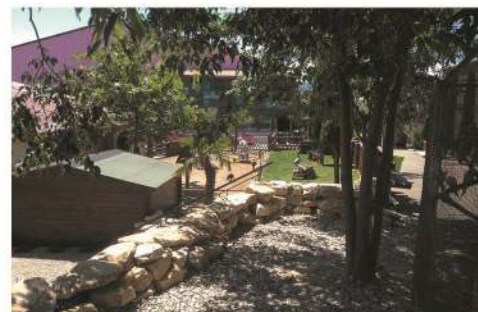
Espace extérieur ombragé