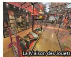
La Maison des Jouets