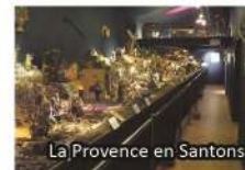
La Provence en Santons