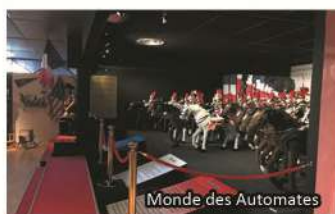
Monde des Automates