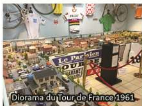
Diorama du Tour de France 1961