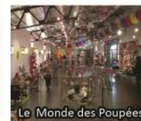
Le Monde des Poupées