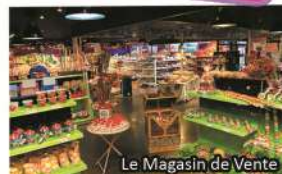
Le Magasin de Vente