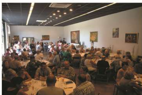
Salles de restauration

Restaurant avec salles groupes privées Aire de pique-nique couverte Mini-ferme et volière exotique