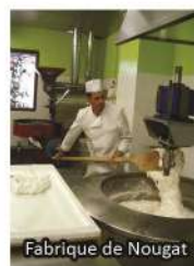
Fabrique de Nougat

Visites libres (environ 1h30) Dégustation gratuite Site climatisé Accès PMR 100% Nombreux endroits pour s'asseoir Explications français/anglais