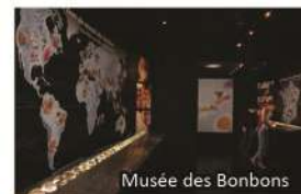
Musée des Bonbons