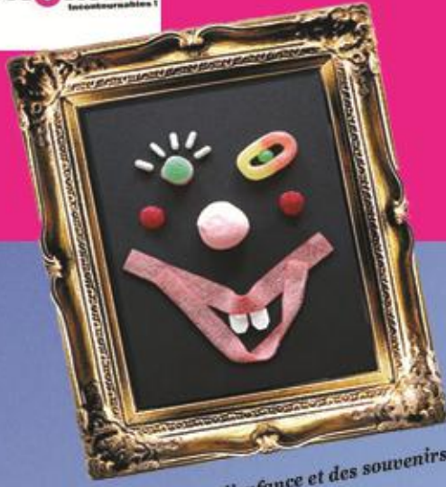
Multi-musées de l'enfance et des souvenirs